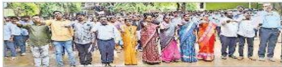
మాచవరం: ప్రతిష్ఠ చేస్తున్న అధ్యాపకులు, విద్యార్థులు